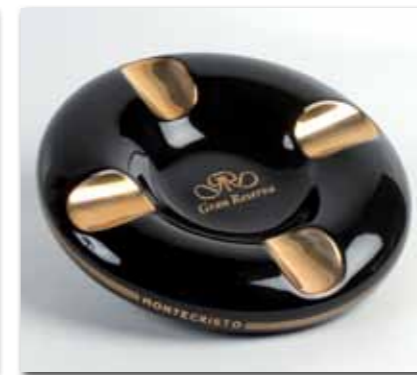
Aschenbecher Gran Reserva