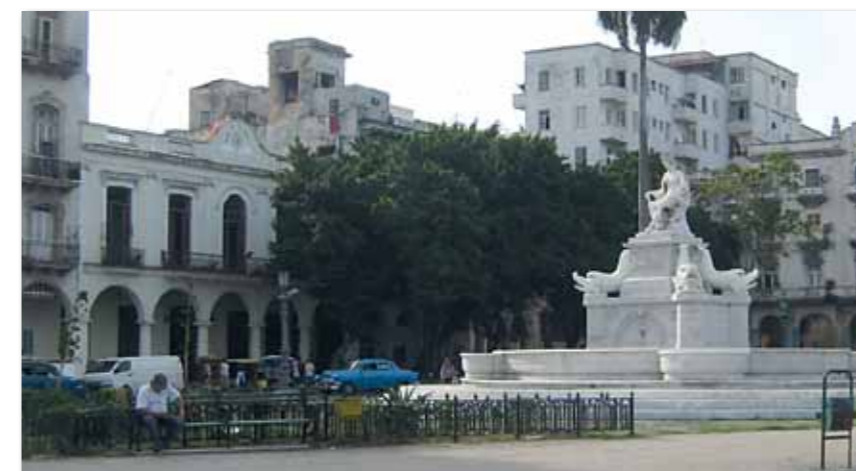
Links des Springbrunnens sieht man die eher unscheinbar wirkende ehemalige Manufaktur.

Der berühmte Springbrunnen, der Fuente de la India, dessen Carrara-Marmor auch heute noch in strahlendem Weiß vor der Manufaktur erstrahlt, hat damals schon existiert. Auf historischen Zeichnungen, die es von der Fabrik gibt, ist er immer mit dargestellt. Allerdings gibt es Abbildungen, auf denen der Springbrunnen auf der falschen Seite steht. Doch das wird wohl künstlerische Freiheit gewesen sein.