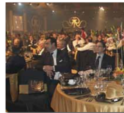
Galaveranstaltung 2009 bei der Einführung der Gran Reserva Siglo VI

der Marke und der elegante Schriftzug der Gran Reserva, der durch ein fein geschwungenes G und R dargestellt ist. Jede Kiste ist außerdem mit einer goldenen Plakette versehen, die die Nummer der Kiste angibt. Die Zigarren selbst tragen eine zweite Bauchbinde, bei der auf schwarzem Grund die goldenen Initialen G und R zu sehen sind. Passend zu den Zigarren gibt es einen in dezentem Schwarz gehaltenen runden Aschenbecher im Design der Gran Reserva. Umlaufend ist ein goldener Schriftzug der Marke auf schwarzem Grund zu sehen, die Ablagen sind golden und die Mitte des Aschenbechers zieren die beiden geschwungenen Buchstaben G und R für Gran Reserva.